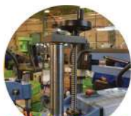
پیچ تنظیم ارتفاع