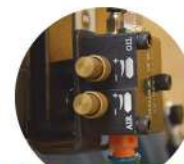
ولوم های روانکاری