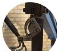
هد زاویه گیر