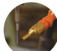
نازل پاشش روغن